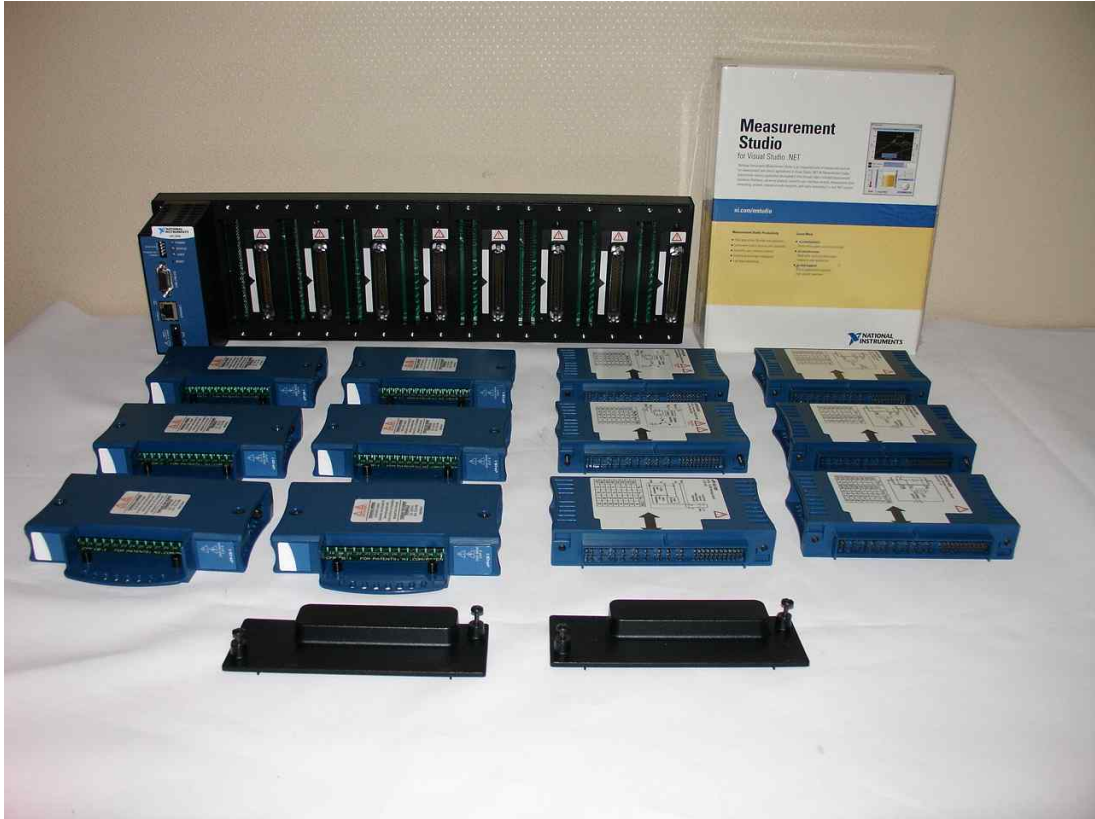
전력선의 각종 데이터 분석

777318-330 : cFP-DI-330, Digital Input Module(AC/DC Vsink/source), 8 channel