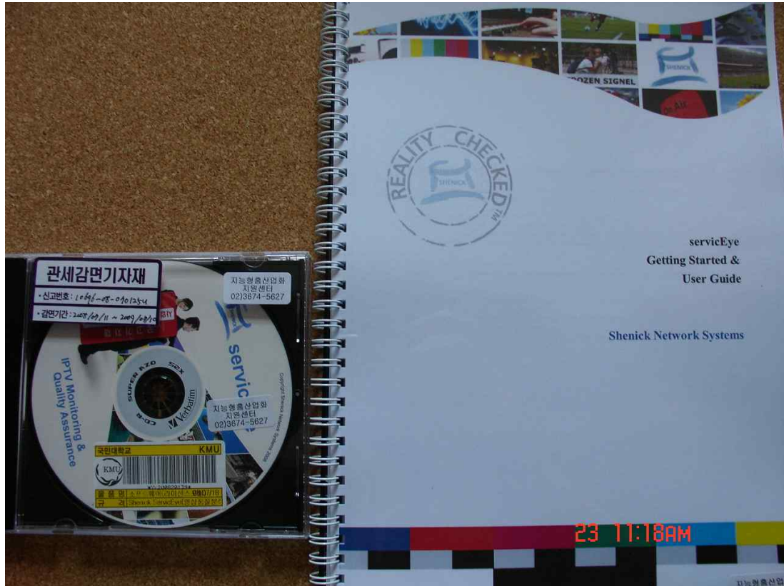
소프트웨어, IPTV Monitoring & Quality Assurance analysis