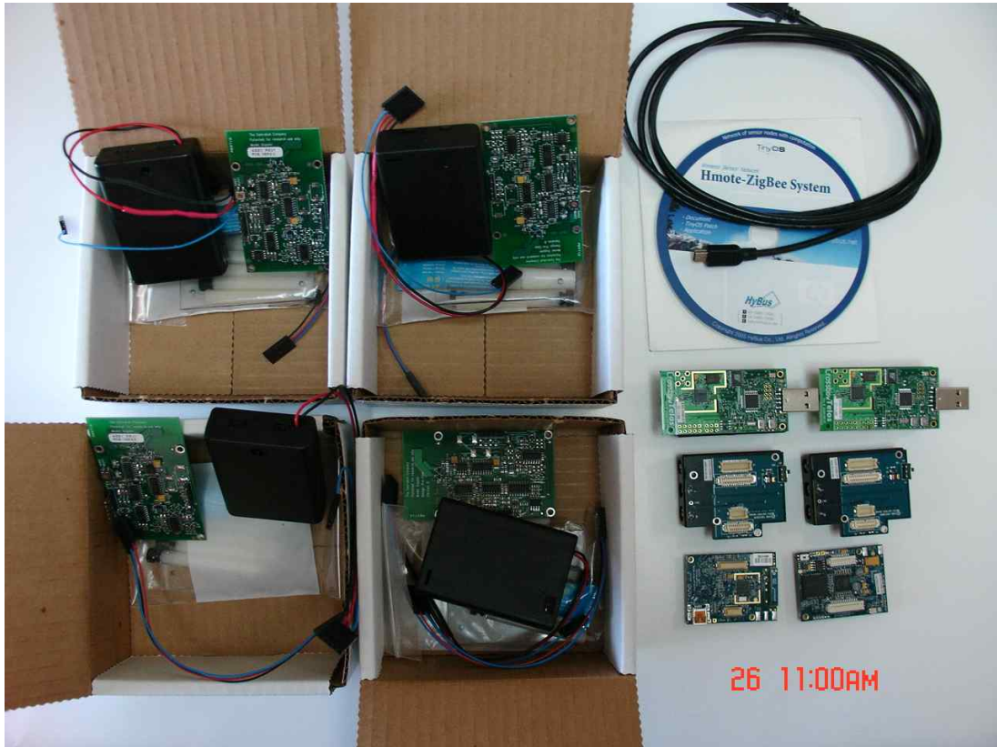
무선 홈 네트워크 센서 측정 및 시험

Tiny OS, Pluse doppler radars, Wiring Harness(imote2s) telosB for use with tinyOS, wiring Harness(telesB)