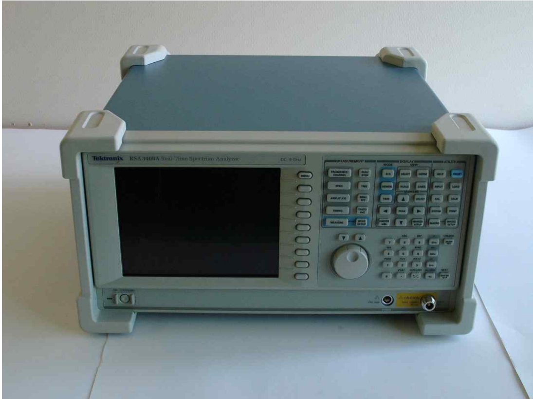
무선 스펙트럼 분석