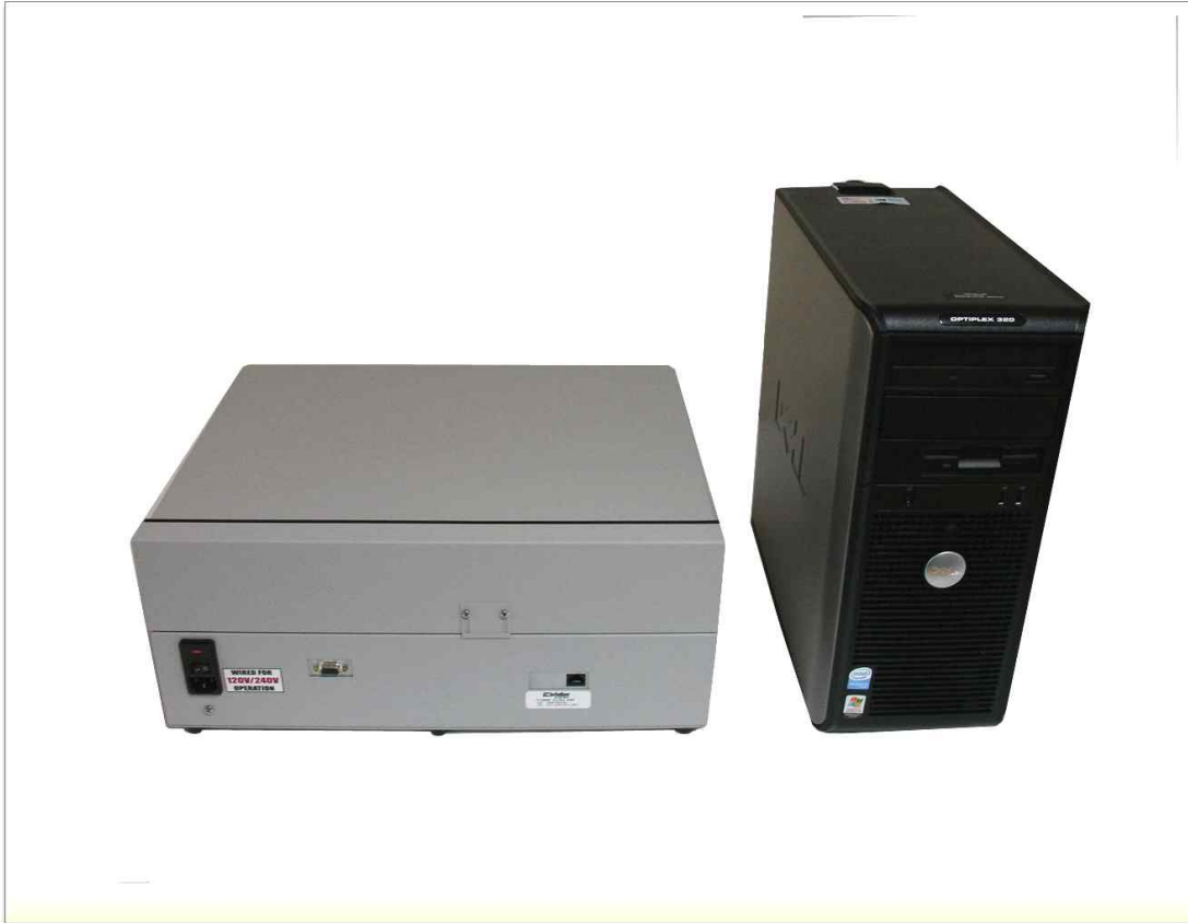
200M급 PLC AV 모뎀 속도 테스트