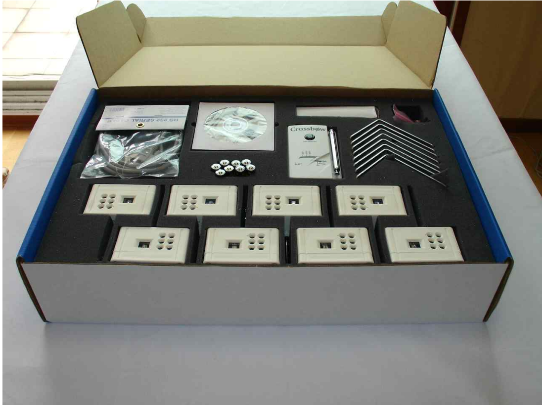
센서 네트워크 구축

MSP410CA Mote Security Package(Unit sold system configuration or only customer has made system)