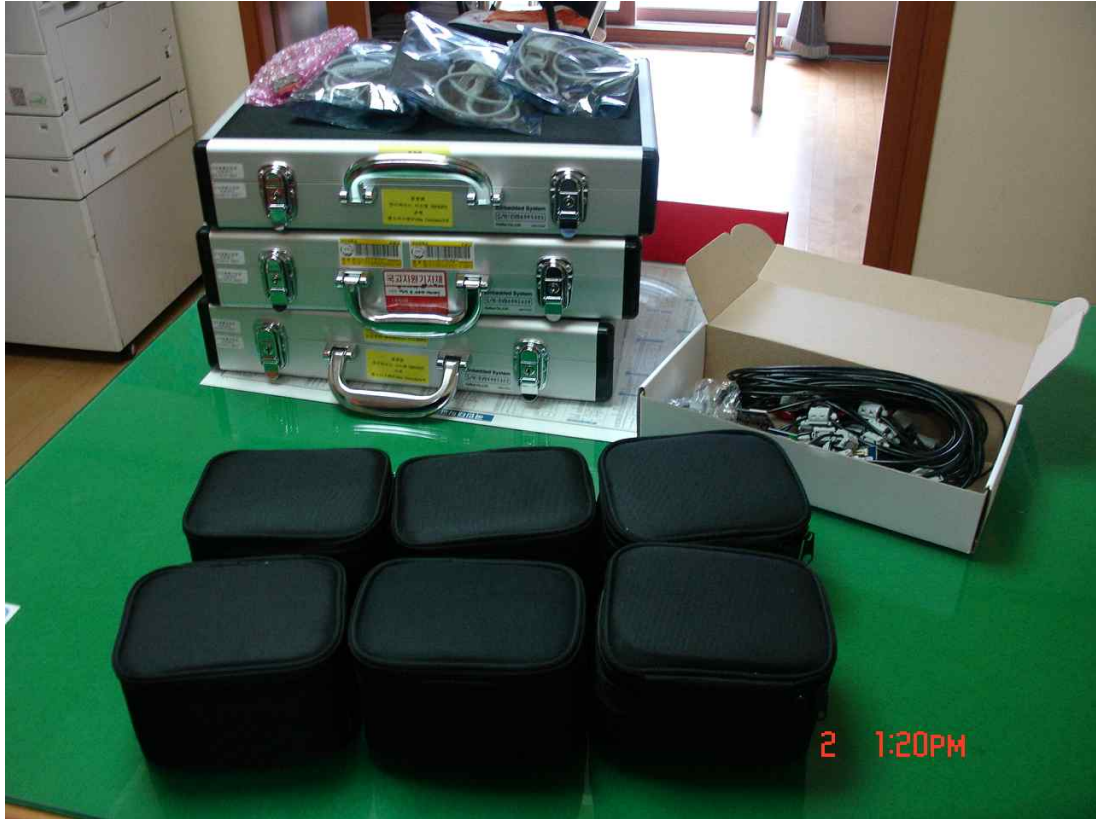
MOTE, 열당 열압 측정