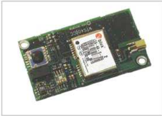
무선 센서네트워크 측정

Compatible with MICAz/MICA2 Processor/ Radio Boards