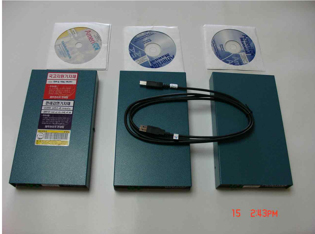
일반 전화 Call Emulation 및 음성 품질 측정